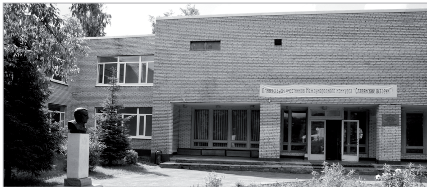
ДШИ №1 им. Г.В. Свиридова, г. Балашиха Московской области

Впереди 2015 год - год 100-летнего юбилея русского композитора Г.В.Свиридова. Нам посчастливилось в своей жизни прикоснуться к его творчеству, музыке, духовно-нравственным принципам, взглядам и жизненным позициям. Мы глубоко убеждены, что своей постоянной работой в области освоения большого творческого наследия Г.В.Свиридова мы сможем занять определенную нишу в праздновании юбилея композитора и оценке того, что сделано в преддверии его 100-летия. И книга, которую Вы держите в своих руках, наш серьезный вклад в предстоящий юбилей.